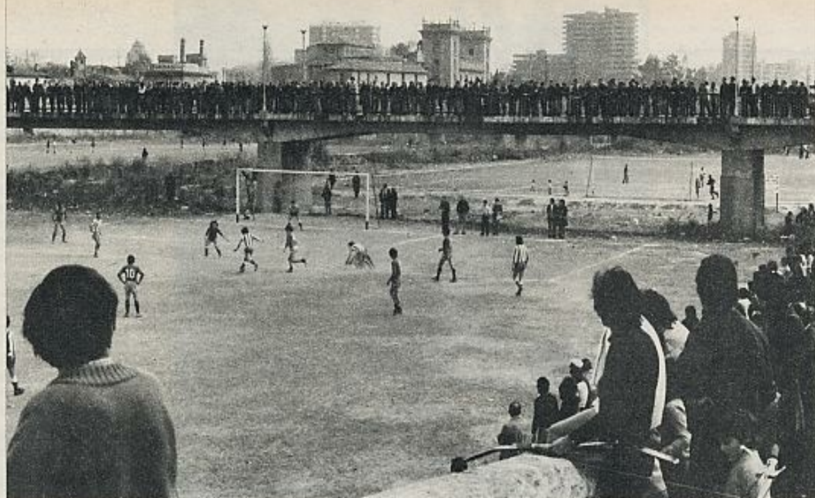
Mientras las leyes se acomodan a los hechos, todos los domingos el antiguo cauce del Turia se puebla con deportistas.