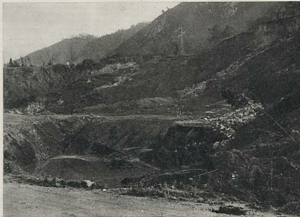
En vista de la anarquía de la iniciativa privada, sólo la planificación estatal puede resolver el problema de Caravia. En la foto, la cantera de San Lino.

En contradicción con los datos de la empresa, el informe SADEI y