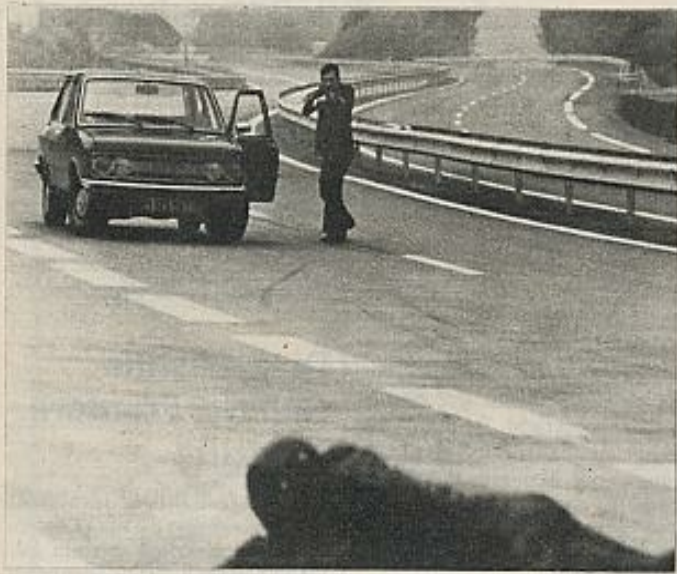
"La agresión" ("L'agresion", 1975), de Gérard Pirès.

cativa. Cambia la circunstancia histórica, porque mientras "Le vieux fusil" se desarrolla durante la ocupación nazi en Francia y es contra miembros de las SS como se lanza el protagonista (un médico que se ha querido mantener al margen de la política, lo que implica en el film algunas connotaciones sobre el colaboracionismo), en "L'agresion" es una banda de motoristas que recorren las actuales autopistas francesas quienes ocupan el objetivo de la escopeta del "justiciero". Pirès —al contrario que Enrico— intenta al final de su película darle la vuelta al esquema, mostrando el trágico error en que dicha acción justiciera puede caer fácilmente. Pero lo hace de manera tan gratuita, dentro de una película que cabe definir globalmente así, que su giro en la conclusión apenas tiene ningún valor. Ni Enrico ni Pirès hacen otra cosa que contribuir —sin analizarla jamás, sin reflexionar sobre ella, sin buscar sus motivaciones— a una violencia que obtiene en su país de origen buenos dividendos comerciales. Porque situarla entre los nazis o exculpar a las bandas motorizadas no es así más que una coartada de conciencia. ■ FERNANDO LARA.