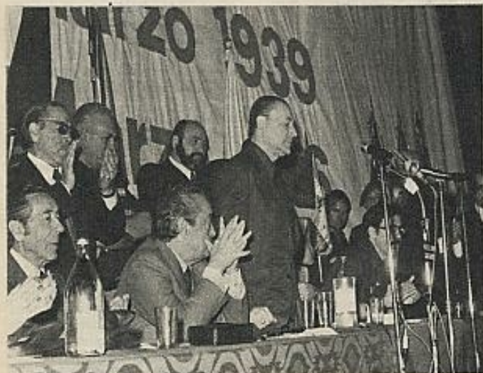
Blas Piñar, durante un mitin de Fuerza Nueva.

En 1974, Fuerza Nueva definió su posición política frente a la política del presidente Arias en un fa-