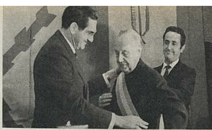
Raimundo Fernández Cuesta, Frente Nacional Español, recibiendo la Gran Cruz de Carlos III.

te proyecto, son los Tribunales ordinarios de Justicia los que entenderán de las responsabilidades civiles y penales de las asociaciones, que deberán ser reconocidas por el Ministerio de la Gobernación, y no por el Consejo Nacional del Movimiento, como estipulaba el Estatuto de 1975. Habrá un Tribunal de Garantías que se constituirá en una Sala del Tribunal Supremo y que atenderá las cuestiones administrativas.