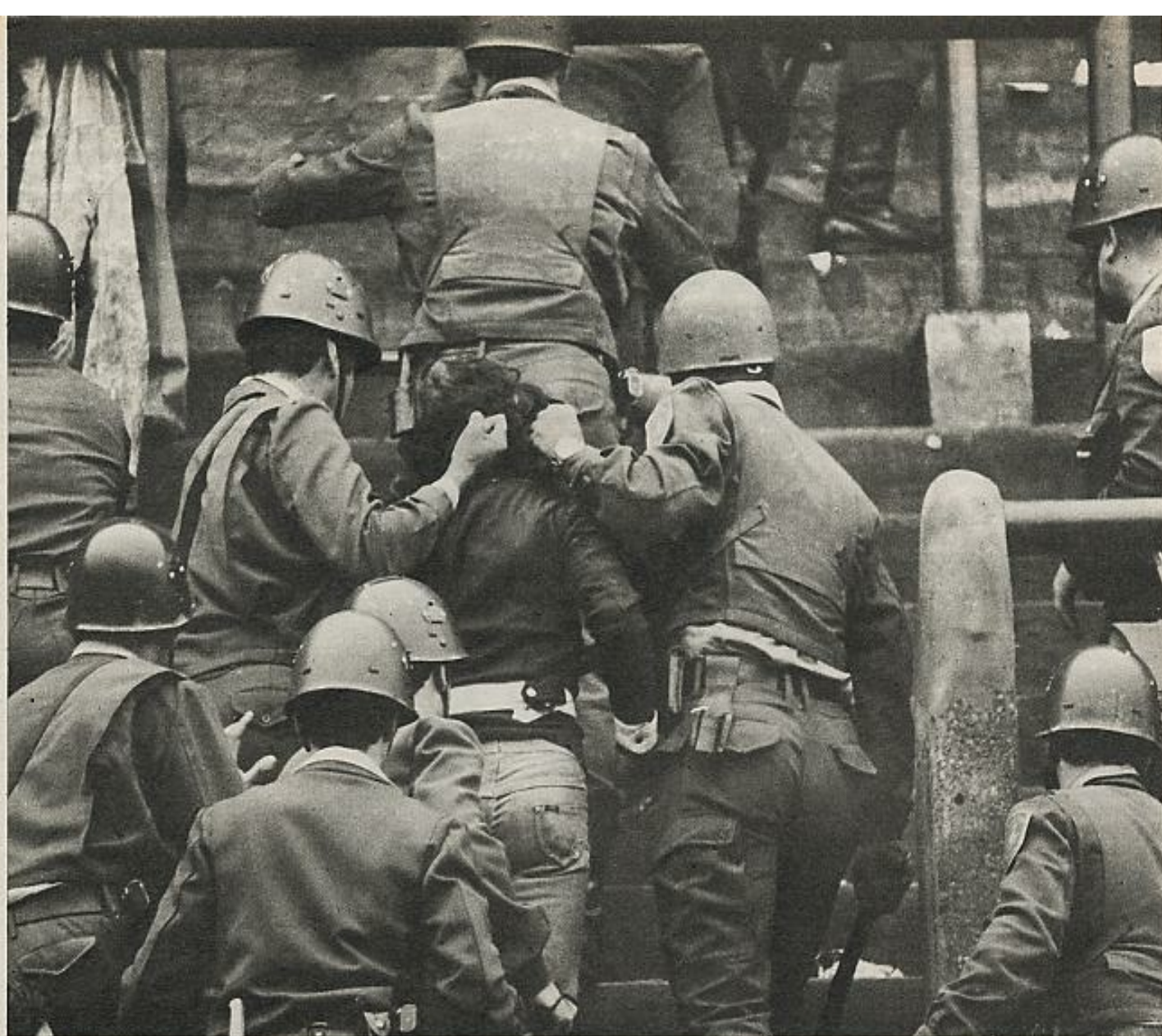
América Latina está haciendo inspirados aportes universales al desarrollo de métodos de tortura, técnicas del asesinato de personas e ideas, cultivo del silencio y siembra del miedo. (Represión en Buenos Aires.)

mar: si un 5 por 100 de la población latinoamericana puede comprar refrigeradores, ¿qué porcentaje puede comprar libros? ¿Y qué porcentaje puede leerlos, sentir su necesidad, recibir su influencia?