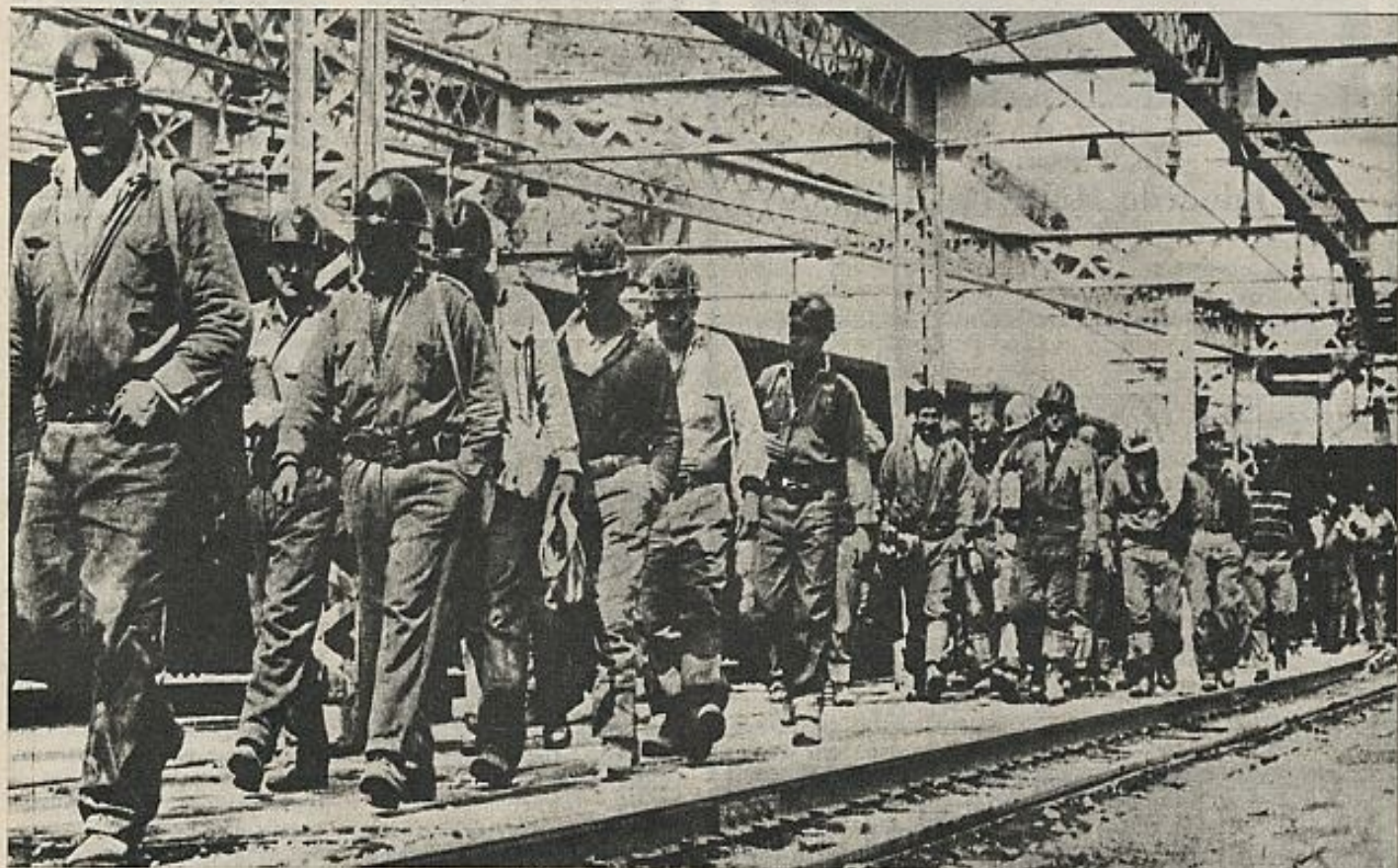
No se debe reivindicar para los escritores un privilegio de libertad al margen de la libertad de los demás trabajadores. (Obreros en una industria chilena de cobre.)

11 Sostener que la literatura va a cambiar de por sí la realidad sería un acto de locura o soberbia. No me parece menos necio negar que en algo puede ayudar a que cambie.