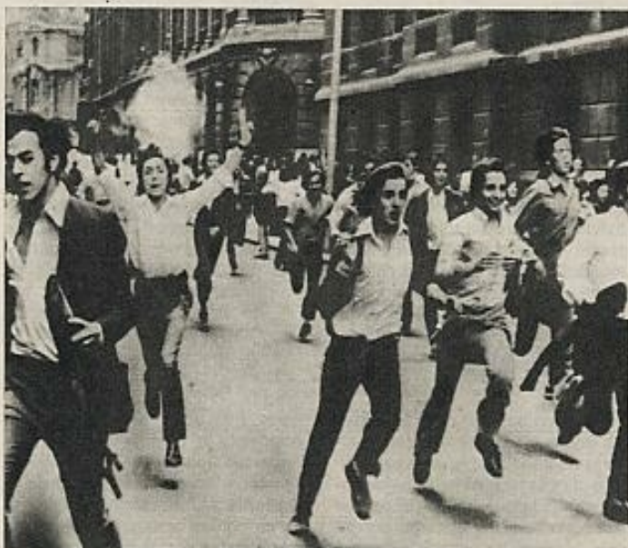
Los países que no dan a los jóvenes posibilidad de participación política, facilitan la proliferación de una falsa "cultura de protesta". (Manifestación en Santiago de Chile.)

el modo de vida de sus equivalentes metropolitanos.