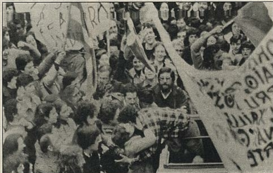
La amnistía total para los jóvenes vascos: una cuestión todavía pendiente.

"Amnesty International ha dado un estatuto particular al prisionero cuyos únicos "delitos" sean por