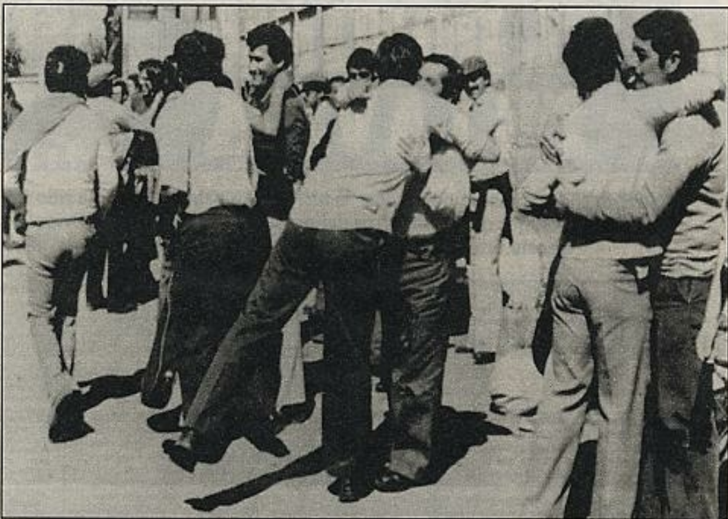
Un grupo de presos políticos chilenos en el momento de ser liberados de la prisión de Tres Aleros, próxima a Santiago. El "dossier" chileno de Amnesty International sigue creciendo.

M.-J. P.—Su pregunta tiene varias respuestas. La primera es que Amnesty International goza de un estatuto consultivo en organizaciones intergubernamentales internacionales, como son las Naciones Unidas y todas las familias derivadas de su ámbito, y en el seno del Consejo de Europa; posee el estatuto de observador en la Organiza-