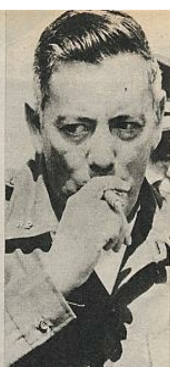
General Omar Torrijos: "Somos un vietcong... en potencia".

El proceso democratizador está paralizado en Panamá. La economía del país continúa en manos de la tradicional oligarquía importadora. Se trata de mantener la ficción de que el país depende casi enteramente de su situación geográfica, del Canal, mientras las perspectivas de un arreglo lógico del problema siguen siendo tan oscuras como para no permitir a las puertas de 1977 ni un vislumbre del fin de la situación. ¿Qué impide imaginar que dentro de otros ocho