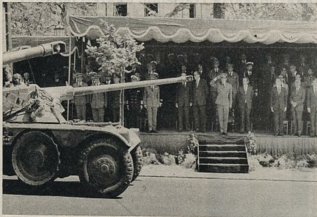
La punta del cañón tapa la cara de Soares. Desfile del 25 de abril.

Alvaro Cunhal ha acusado al Gobierno de seguir una política capitalista e imperialista. El lema de la rueda de prensa de Cunhal era "¡Recuperación económica, sí! ¡Recuperación capitalista, no!". Para el PCP, la ley sobre los sectores público y privado es anti-constitucional. La Ley Fundamental del país establece "la irreversibilidad de las nacionalizaciones, que son parte integrante del sistema económico consagrado constitucionalmente". La alternativa que propone el PCP se apoya en el gran campo de actividad que la Constitución reserva a la iniciativa