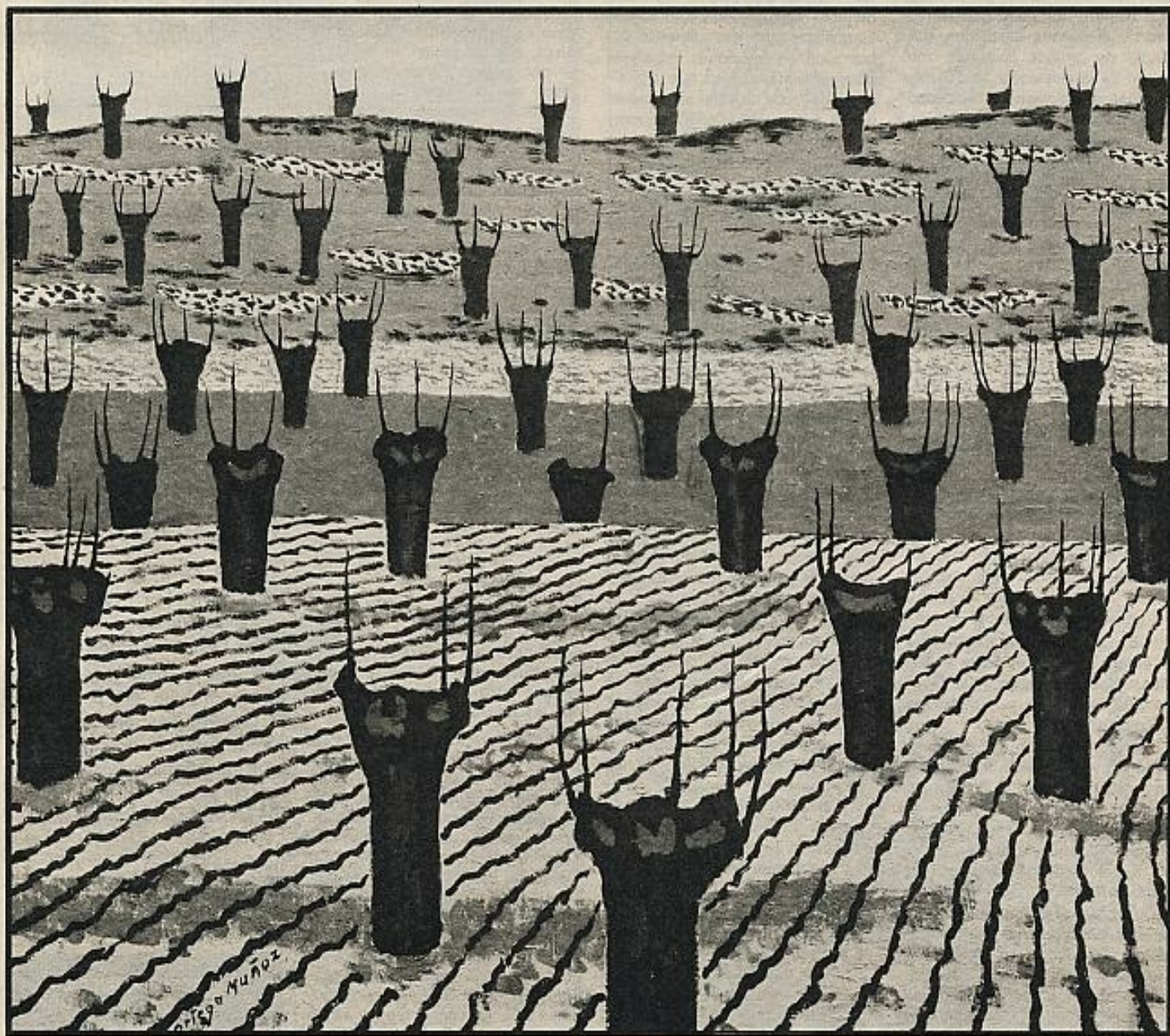
"Castaños y tierras labradas".

En lo cual, según mi criterio, estriba la originalidad y el fujo específico de este pintor. Pues, por una parte, es un paisajista: Es un espectador de algo que, por definición, tiene que quedar fuera de sí mismo; pero, por otra parte, él