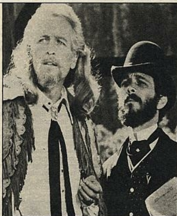
"Buffalo Bill", de Robert Altman.

No es una cuestión de purismos. De hecho, en nuestro país hemos tenido que criticar decenas y decenas de películas que venían mutiladas por imperativos de una censura fascista e inquisitorial. En las columnas