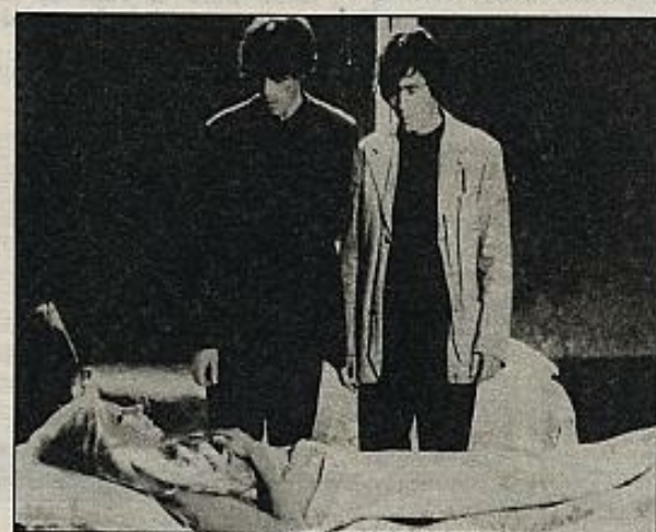
"Ostia", de Sergio Citti (1970).