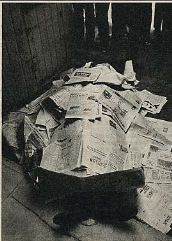
Envuelta en hojas de periódicos —entre ellos, el diario derechista "El Mercurio"—, una víctima del golpe sangriento de Pinochet.

en sus redacciones, se esconden de hecho intereses de clase que, en momentos excepcionales como los vividos por Chile entre 1970 y 1973, saltan descaradamente a primer plano.