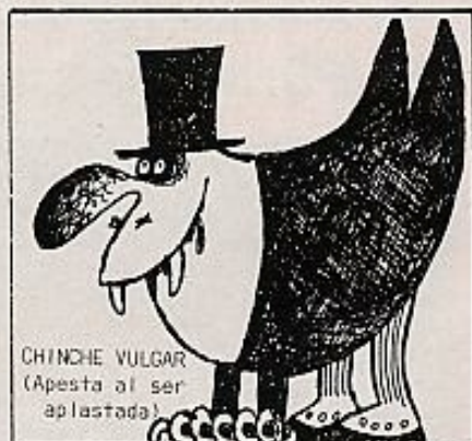
CHINCHE VULGAR (Apesta al ser aplastada)

A LAS NUEVE MENOS CUARTO, YO YA TENIA MI NUMERO: EL TRECE. Y ESPERABA SER LLAMADO PARA EL ANALISIS PREVIO A LA EXTRACCION. A LAS NUEVE EN PUNTO ENTRARON LOS SIETE PRIMEROS. ME ENTRÓ UN HAMBRE ATROZ Y PENSE QUE DEBERIA HABERME DESAYUNADO CON UN BUEN VASO DE LECHE. A MI LADO, UN MATRIMONIO DE EDAD ALGO MAS QUE MADURA, CON LA MISERIA REFLEJADA EN LOS ROSTROS SE AERAZA COMO PARA PROTEGERSE DE NUESTRO ENEMIGO COMUN: EL HAMBRE INVISIBLE.