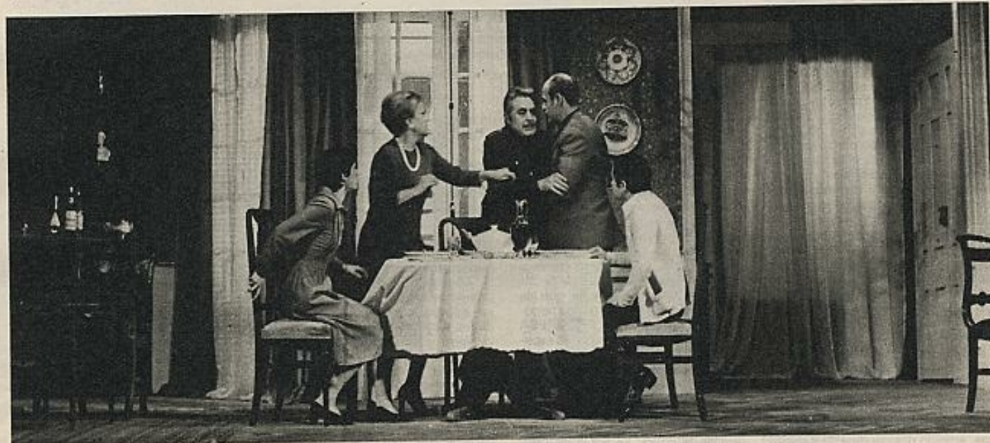
"La condecoración", de Lauro Olmo.

Pero esa es otra cuestión, no exenta de una amarga paradoja: la posibilidad de que buena parte de esos dramas irrepresentados contaran hasta tal punto con las circunstancias adversas que el hecho de poder verlos sobre un escenario implique una destructora contradicción. Es seguro que en muchos casos, en el de los auténticos dramaturgos, no será así, pero en otros no faltará quien escriba —supongo que con cierto regustillo— que "cómo es posible que se defendiera una obra cuya mayor importancia era su prohibición", sin advertir que a la frase cabe darle la vuelta, en el sentido de preguntarse "cómo es posible que nadie defendiera un régimen que condujo a la estimación automática de los autores prohibidos".