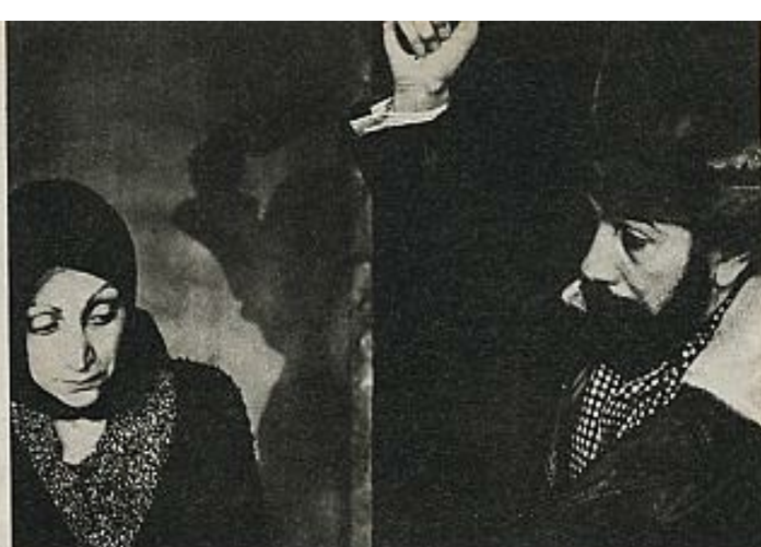
"La madre", de Gorki, en la versión del GIT.

En otro lugar del mismo libro cuenta que, en la primavera del 15, hallándose en el frente, tuvo por primera vez conciencia de cuanto podía haber de alienante en la condición de actor. Tumbado en el suelo, bajo el fuego enemigo, había re-