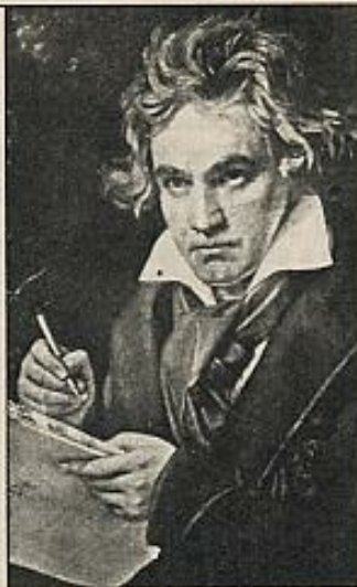
Ludwig van Beethoven.

La vertiente más práctica de este progreso imparable de los estudios sobre Beethoven es la incidencia que tienen en la interpretación de sus obras. Y es también la vertiente que más problemas introduce por cuanto, dada la misma fecundidad y proliferación de esos estudios, a la postre no acabamos de hacernos una idea determinada de la imagen beethoveniana, sujeta a una especie de baile o juego de ping-pong, por el cual hoy nos encontramos a Beethoven convertido