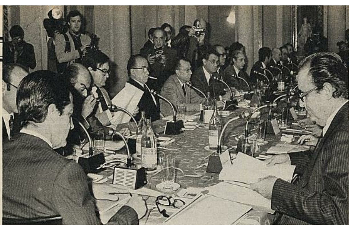
Reunión en la Moncloa del Gobierno con representantes de los partidos políticos: una sustitución del Gobierno de concentración.

res de la derecha y prescindiendo de la izquierda democrática. Esos sectores le han ido abandonando rápidamente. Quizá la idea de apoyarse en elementos antidemócratas para establecer una democracia frente a la oposición de los sectores de opinión democráticos era descabellada; pero podía haber dado resultado de no ser por el miedo y la intolerancia de aquellos cuya ayuda requería don Adolfo Suárez. En esta actitud ha perdido todo un año. Podrían recordarle ahora los convocados de la Moncloa ese año perdido, y por qué ha dejado llegar la situación al deterioro actual. Pero no valdría la pena. Lo que tendrán que hacer es trabajar para que el acuerdo sirva más para salvar al país que para salvar a Suárez, como ha recordado un reticente portavoz del PSOE.