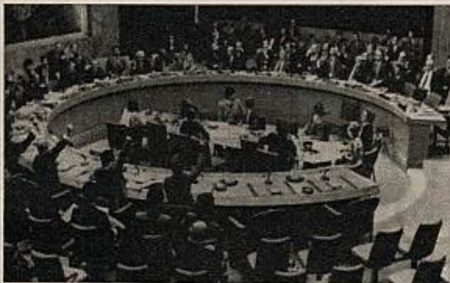
El Consejo de Seguridad de las Naciones Unidas vota por unanimidad el embargo de armas a Sudafrica.

El hecho de que por primera vez en la historia de las Naciones Unidas se apliquen a un Estado miembro y que también por primera vez se aluda al capítulo séptimo —amenazas contra la paz mundial— se consideran como trascendentales desde un punto de vista teórico. Pero no impiden que la sanción no sobrepase lo puramente simbólico. El lenguaje es duro, el acuerdo es unánime; pero la Unión Sudafricana continuará recibiendo armas, estará preparada para un ataque exterior y no cesará en la política de "apartheid". Los Estados Unidos, la Gran Bretaña y otros países han aceptado esta moción para evitar otra de carácter más grave. ■