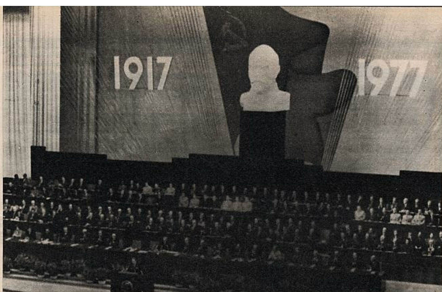
Con presencia de delegaciones extranjeras, el Comité Central del PCUS celebra el 60 aniversario de la revolución de octubre. En la tribuna, Brejnev pronuncia su discurso de la distensión.