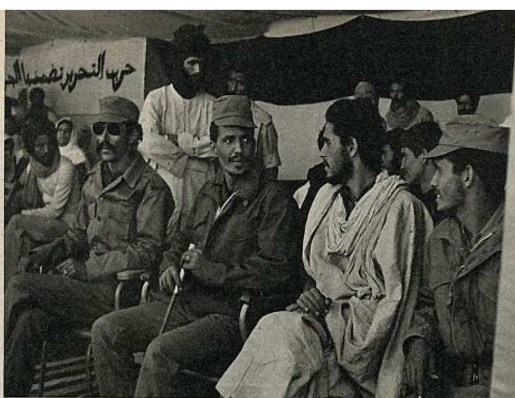
Actos conmemorativos del cuarto aniversario de la creación del Frente Polisario, celebrados el pasado mes de mayo.