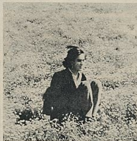
«Cuatro noches de un soñador» («Quatre nuits d'un reveur»), de Robert Bresson.