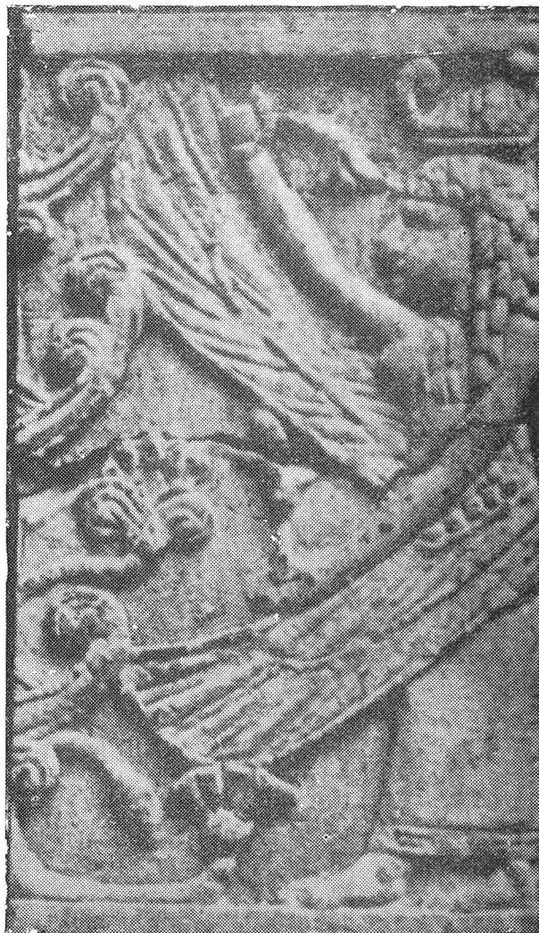
Fig. 3.—Marfil fenicio procedente de Arslan-Tash. Hacia 850 a. J. C. (Según Thureau-Dangin).

La corona que cubre la cabeza, la forma general del cuerpo, las alas y la postura