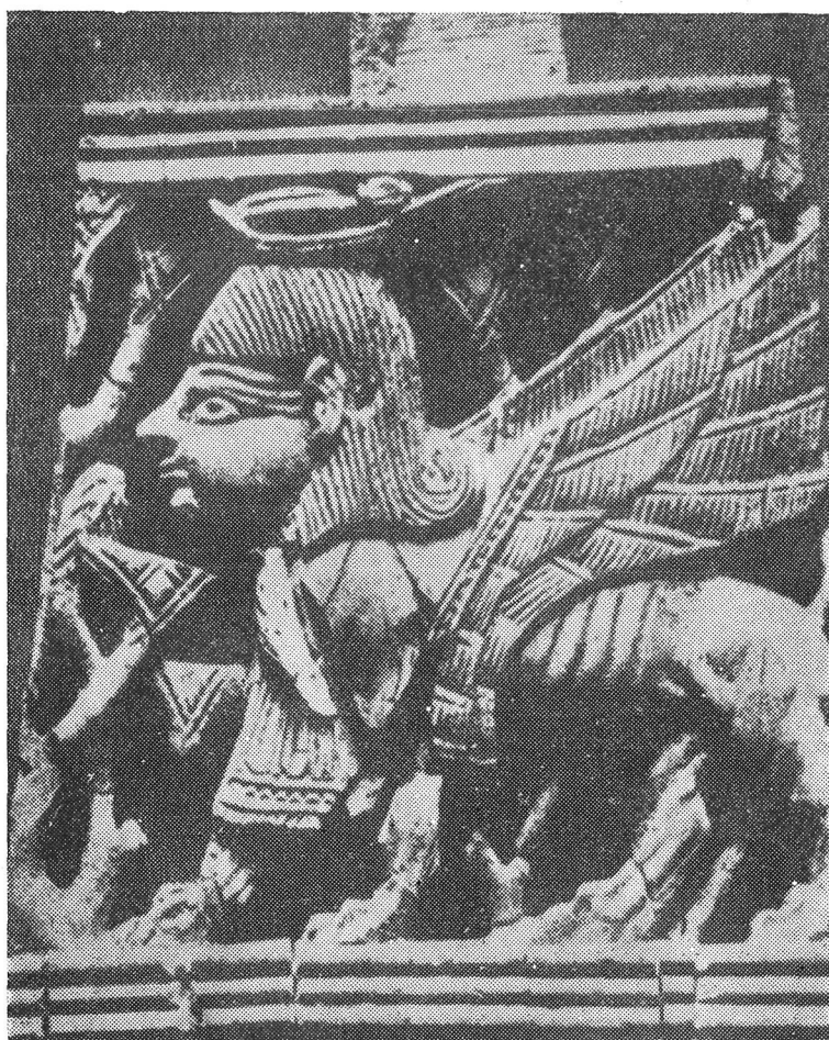
Fig. 4.—Marfil fenicio hallado en el palacio de Acab, Samaria. Siglo IX a. J. C. (Según J. Perrot).

Las esfinges griegas van descubiertas o llevan sobre su cabeza un polos rectangular; la tiara egipcia, como la representada en la terracota de Ibiza, es oriental. Los semitas