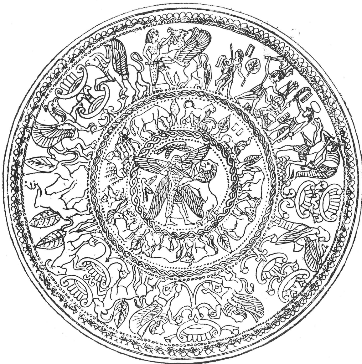
Fig. 7.—Dibujo de las escenas representadas en la pátera de Curium. (Según G. Perrot).

El árbol de la terracota ibicense es un típico árbol fenicio, gemelo no sólo de los representados en los marfiles de Arslan-Tash (fig. 3) (22), sino de los de varias páteras, datables en el siglo VII, a. C., hallados en Chipre, donde hay árboles que son paralelos exactos al árbol representado en el terracota ibicense (23). El motivo de la esfinge sobre él, co-