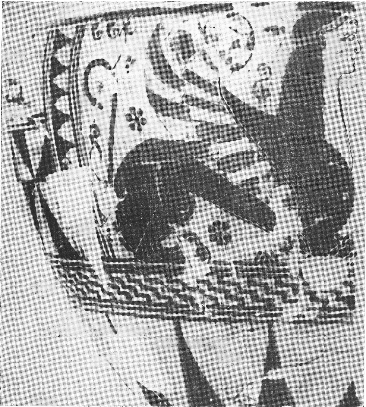
Fig. 2.—Esfinge griega arcaica. (Según Matz).

cuentra también en vasos de los siglos VII-VI a C.; otras dos hojas se dirigen hacia arriba; sobre cada una de ellas, hay una flor hermana de las anteriores, sobre la de la izquierda apoya su mano derecha la esfinge. El espacio comprendido entre estas dos