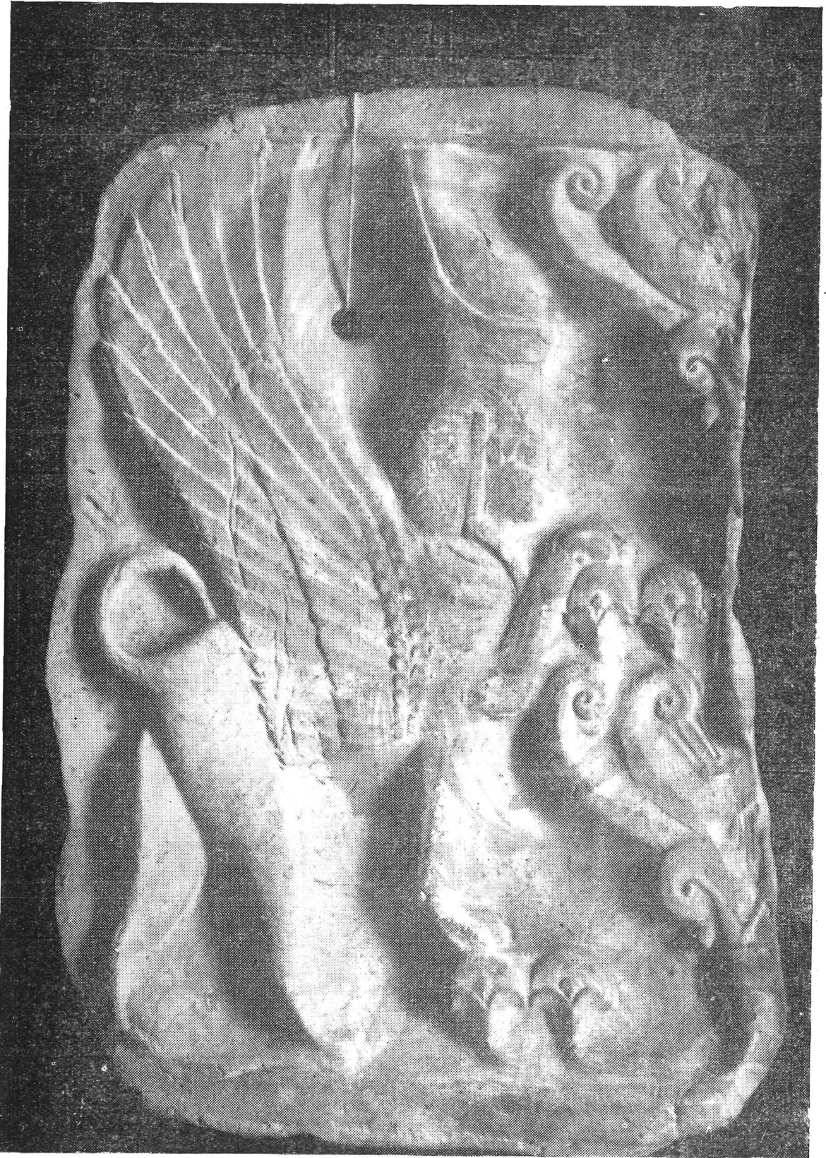
Fig. 1.—Pinax fenicio con esfinge y árbol sagrado. Museo Arqueológico Nacional. Madrid.