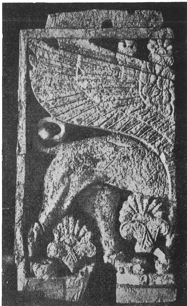
Fig. 6.—Esfinge fenicia. Marfil procedente de Arslan-Tash. Hacia 850 a. J. C. (Según Thureau-Dangin)

dón de plumas en el mismo sitio que la de Ibiza, al igual también que una hallada en Nimrud (17); en tres de las de Arslan-Tash (18) los cordones de plumas le ciñen