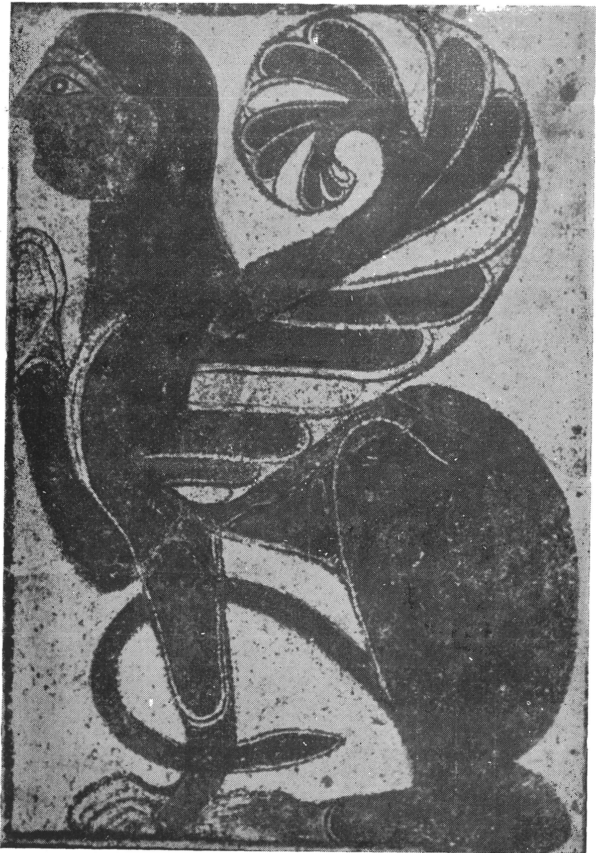
Fig. 8.—Esfinge etrusca procedente de Cerveteri. Entre 575-550 a. J. C. (Según M. Pallottino).