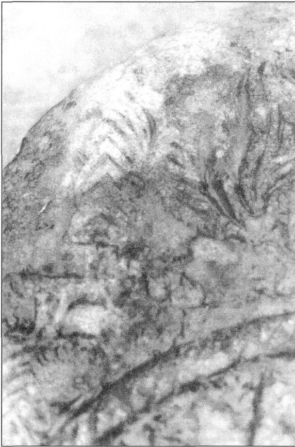
Figura 5. Placa de Santibáñez de Béjar. Ángel (detalle).

ble temática, esta representación debería ponerse en relación con los ángeles que decoran la Caja relicario de la catedral de Astorga 26 . En realidad, el tema parece ser el mismo: la escena de los querubines que están junto al trono del Cordero, que aquí aparece simbolizado por la cruz. Sería sugestivo ver en estas dos figuras a los arcángeles Gabriel y Miguel, habitualmente identificados en la miniatura mozárabe de los Comentarios al Apocalipsis y en el propio relicario de Astorga 27 , aunque el esquematismo y lo fragmentario de la conservación del relieve nos hace dudar. Lo cierto es que la iconografía de la placa de Santibáñez parece remitir a especulaciones apocalípticas (la imagen del toro, las palmas como árbo-