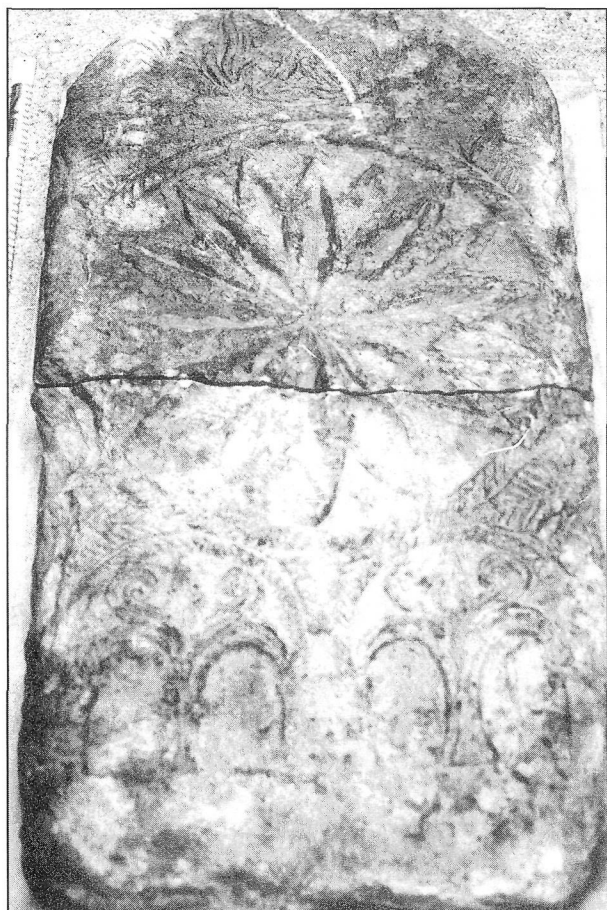
Figura 2. Placa de Santibáñez de Béjar.

ponerlo en relación con las numerosas referencias patrísticas que hacen de la cruz el nuevo árbol de la vida y del triunfo cristiano. No ha de olvidarse que la palma era desde el mundo romano el símbolo del triunfo (Etym. XVII,7,1).