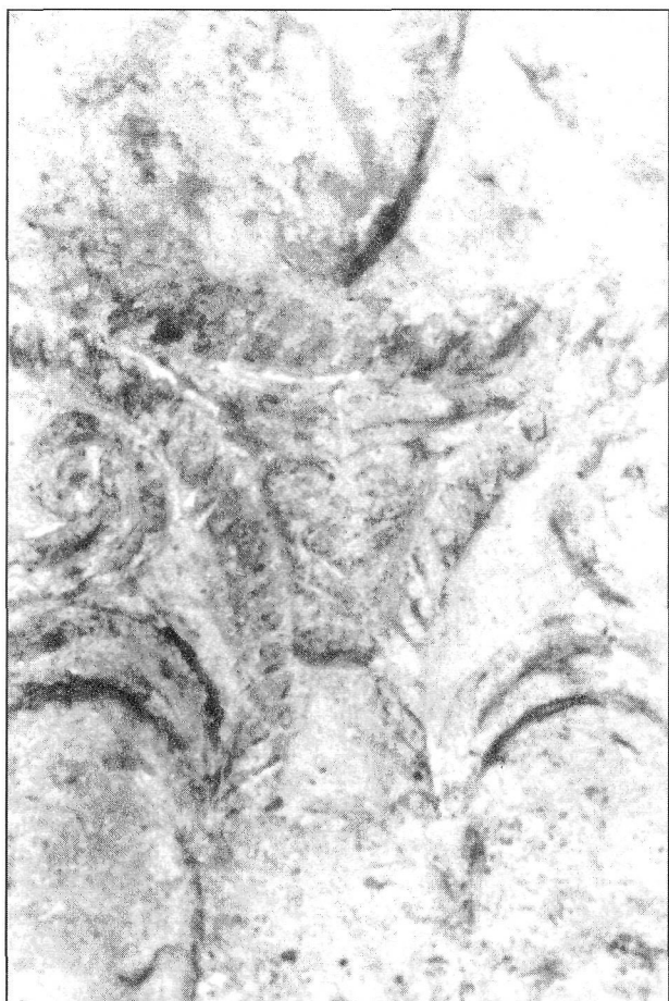
Figura 4. Placa de Santibáñez de Béjar. Bucráneo (detalle).

(fols. 152v-153, fol. 154), en el de Valcavado (fol. 151; fol. 98v), en el de Fernando I (fol. 116v; fol. 240), en el de la British Library (fol. 209), en el Beato mozárabe antiguo de Madrid (fol. 131v), etc. En el caso de Quintanilla hay que señalar su asociación a otros animales simbólicos, también presentes en la ilustración mozárabe, como el simorg y el grifo, y con el friso de lectura eucarístico-bautismal (árboles de la vida, racimos de vid) situado en el registro inferior de la cabecera.