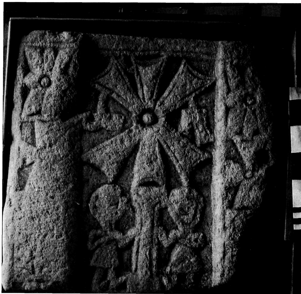
Tablero de canul visigótico (Montánchez)