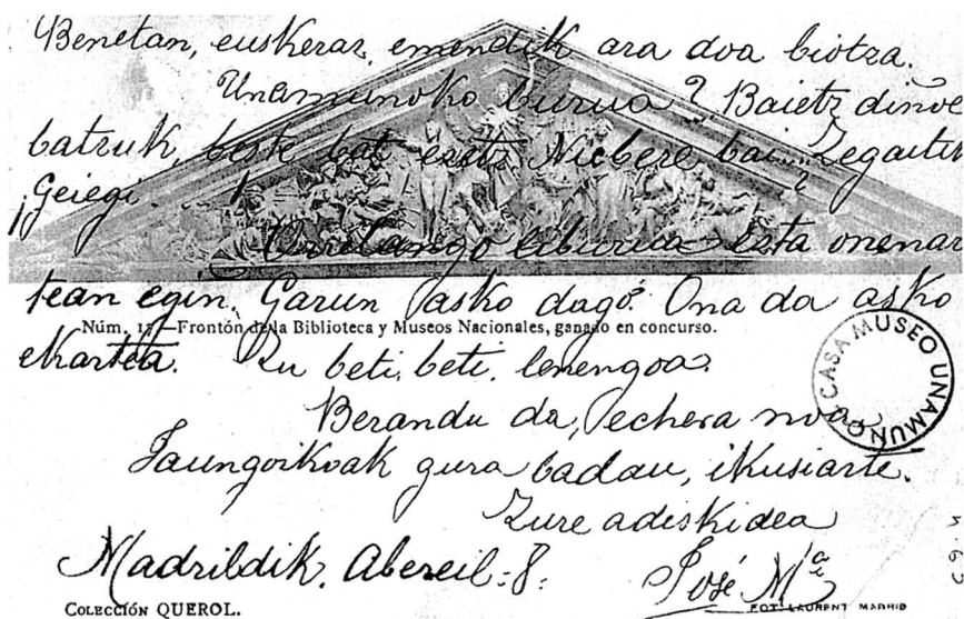
Ilustración 3: Original de la carta 33