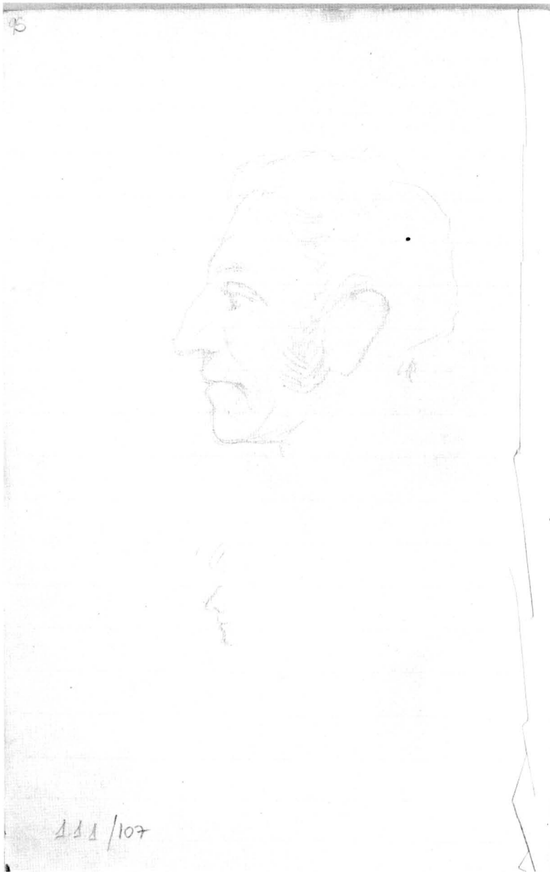
Figura 1. Dibujo, p. 95