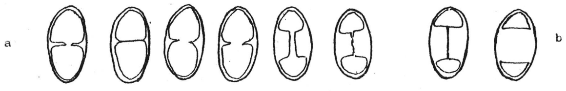
Figura 2: Esporas de C.holocarpa, a) en agua, b) en solución acuosa de K(OH).