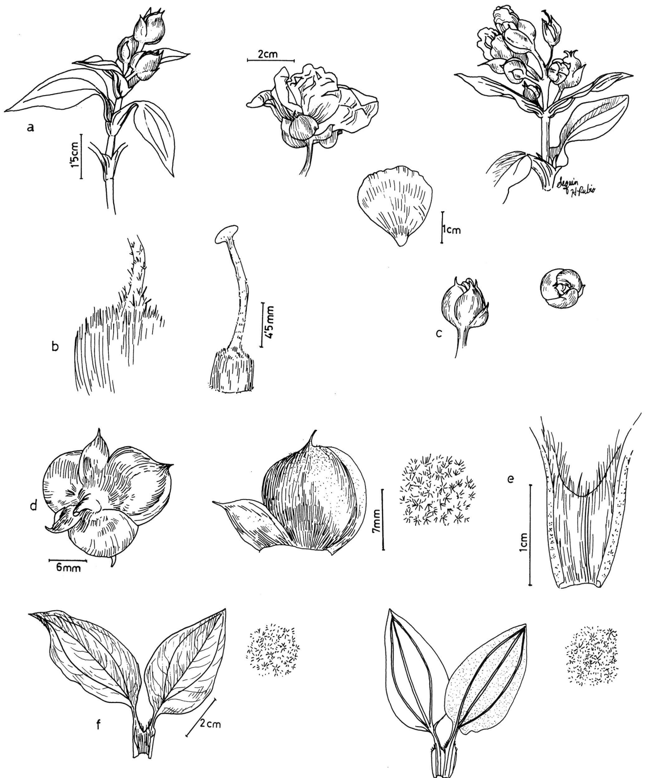
Figura 1. Cistus chinamadensis ssp. chinamadensis . a: Ramas florales y detalle de la flor; b: Gineceo; c: Capullos florales; d: Cáliz; e: Vaina foliar; f: Hojas (haz y envés).