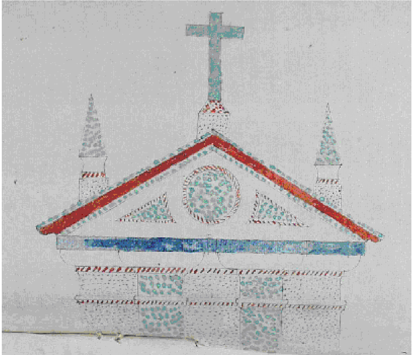
Figura 2: Fontispicio de la fuente nueva, de Pedro de Bárcenas, año 1622. (A. Histórico Provincial de Salamanca, Protocolos , 2702, f. 552r).