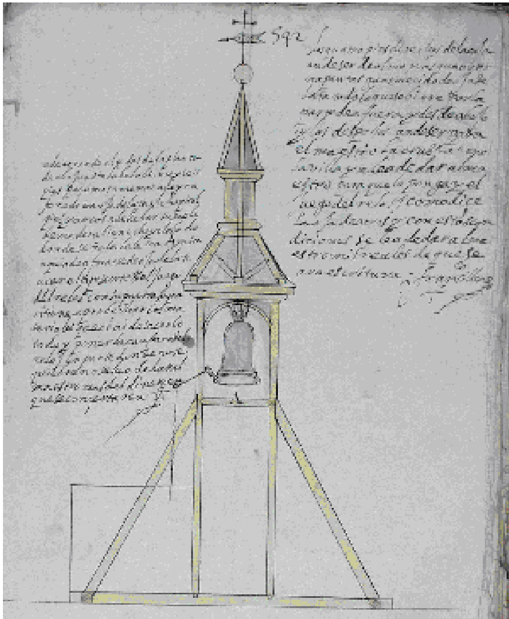
Figura 3: Torre del reloj de la Iglesia de San Miguel proyectada por Francisco Cilleros, año 1644. (A. Histórico Provincial de Salamanca, Protocolos , 2724, f. 542r).