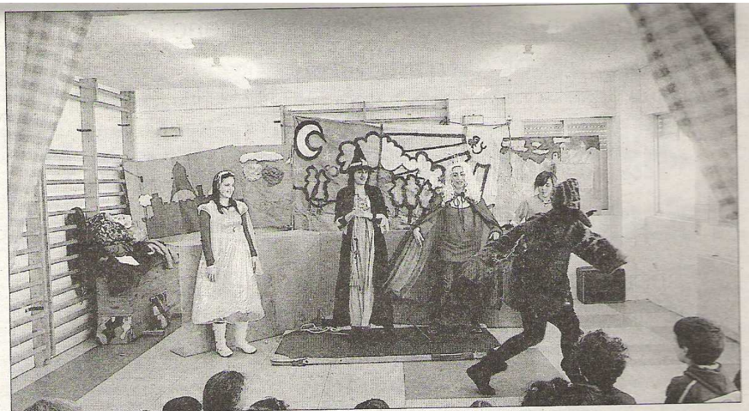
Los alumnos de Magisterio durante una de las representaciones