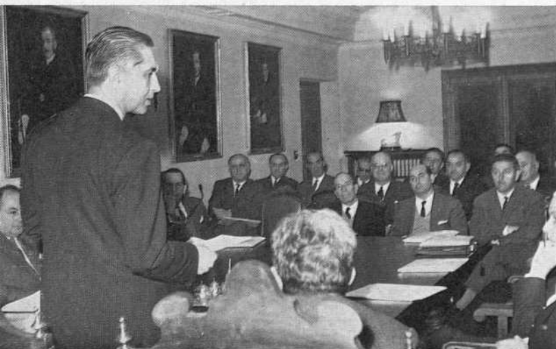
Sesión constituti- va del Patronato Universitario (15- diciembre-65).