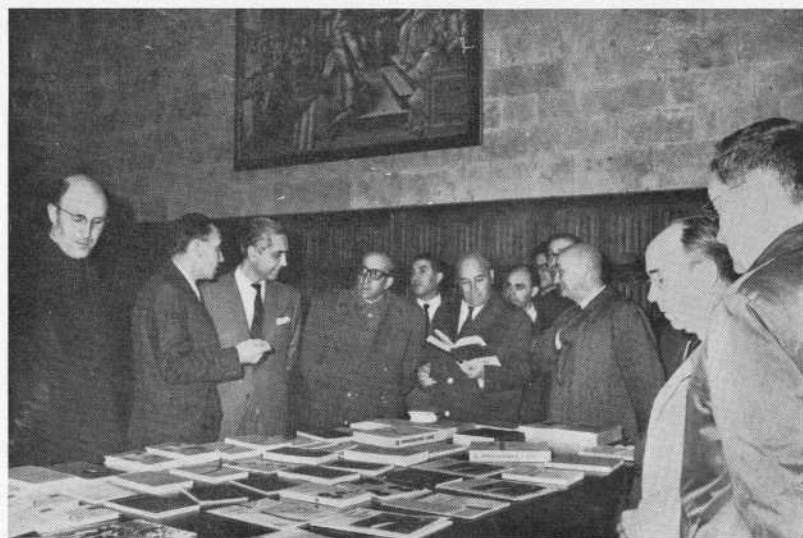
Las autoridades durante la Inauguración de la Exposición Bibliográfica de la Unesco.