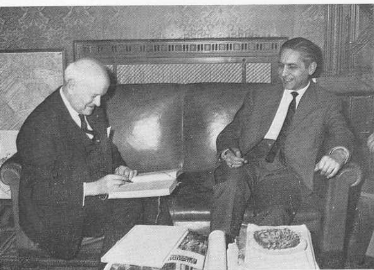
El Embajador de Francia visitó la Universidad de Salamanca.