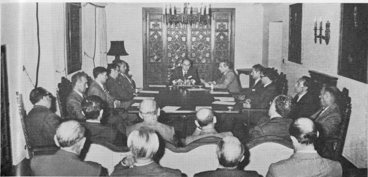
Sesión del Patronato Universitario