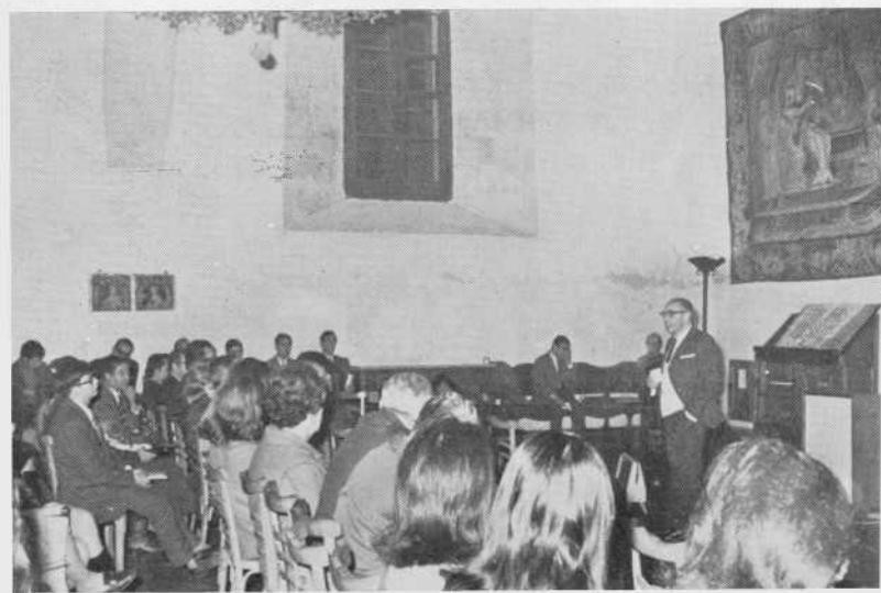
Audiciones de Música Romántica, organiza- das por la Sección de Extensión Universita- ria.