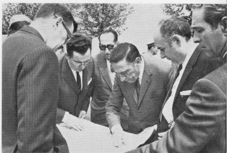
Visita del Director General de Enseñanza Media. Estudio de pla- nos.