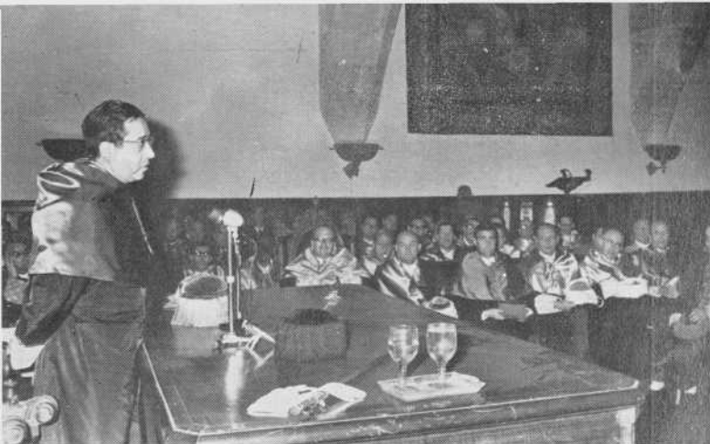
El Excmo. Sr. Ministro de Educación y Ciencia, en el acto de la toma de posesión del nuevo Rector.