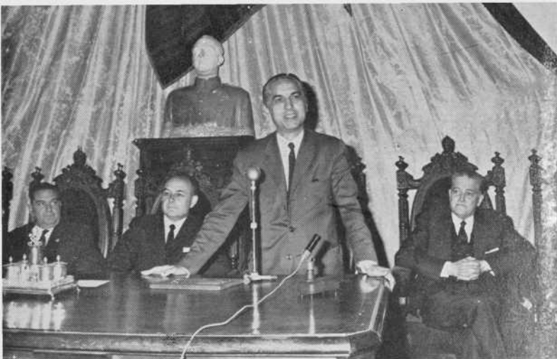
Homenaje de la A.S.U.S. al Prof. Bal- cells.