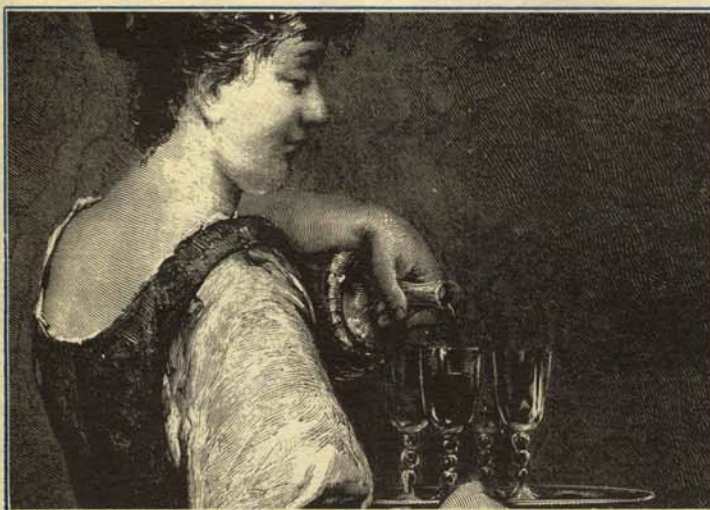
—Voy a poner un poco de Valdepeñas para mejorar este Burdeos.