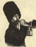
1. Buhonero moscovita, vendedor de uranio enriquecido usado.

Eso nos tememos. Dentro de nada, el aperturismo al Este hará que tengamos que relacionarnos con los siguientes ciudadanos de detrás del telón de acero (acero, por cierto, de muy mala calidad):