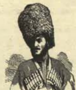
3. Comisario político de la ropa interior de San Peterburgo.