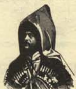
5. Carbonero de Crimea.