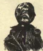
2. Chialán caucasiano, que compra, vende y cambia carros blindados de segunda mano.