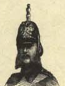
4. Policía de tráfico siberiano.