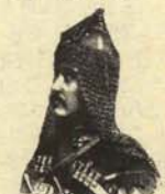
6. «Chansonier» mongol de las estepas del Asia Central (a su tamaño).

EL PERICH SEMANARIO DE HUMOR DENTRO DE LO QUE CABE