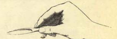
B) Id. a adultos y similares