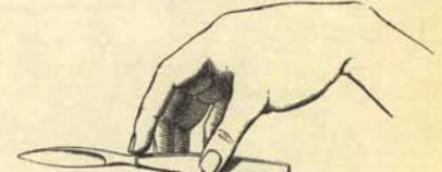
C) Id. a familiares y amigos íntimos.