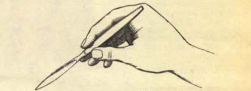
A) Forma de sujetar el arma en las cuchilladas a niños y adolescentes.

Con el fin de impedir que sigan dándose las cuchilladas que se dan sin los modales sociales convenientes, se ha procedido a la reglamentación de esta frecuente actividad moderna. Es así: