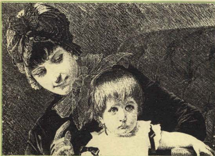
Y si eres malo, el rey Faisal no te venderá petróleo.