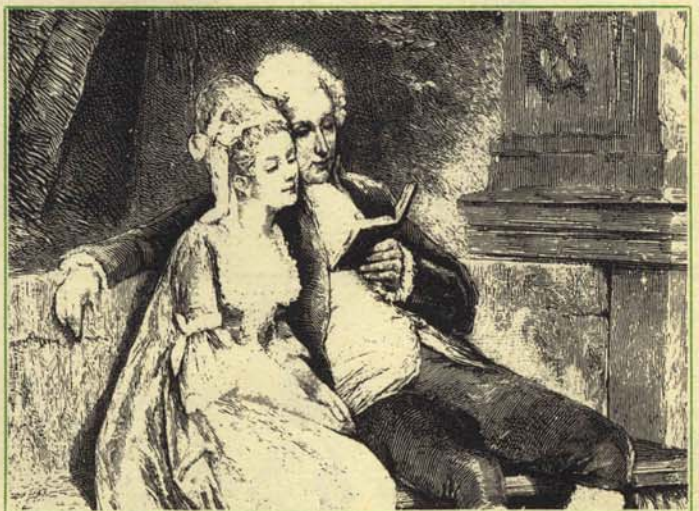
—¡Yo esperaba más del Kamasutra!