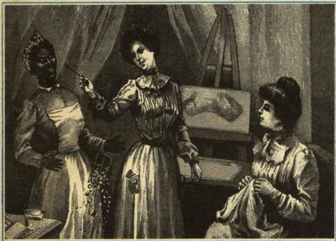
—Para que veas que no soy racista te voy a sacar sólo un ojo.