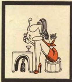
CHICA DE ALTERNE Circe etilica insinuans

La línea que separa a esta especie de la vulpes es, a veces, confusa por ciertas similitudes externas. Uno de los elementos de distinción, aunque no muy seguro, es que estén de un lado o de otro en la barra de los bares (las de dentro, circe etilica; las de afuera, vulpes fornicatrix), pero comparten el suéter ajustado, el escote grande (practicando ambas lo que algún autor ha llamado «suerte del agache», es decir, inclinación para mostrar) y la invocación ritual con que entran en relación con la gente: «Guapo, ¿me invitasss?». Sin embargo, la circe suele padecer una acusada hidrofobia, que se localiza en agua teñida con té, de la que consume enormes cantidades y a la que, incorregible mitómana, bautiza con nombres hilarantes: «Jota Bé, con agua», «Chivas on the rocks», etcétera. Tiene, finalmente, otro punto de contacto con la vulpes: al cierre del establecimiento suele ser recogida por un amigo con el que desaparece.