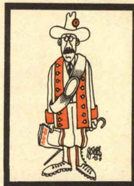
GUARDABOSQUES URBANO Oculator repressus osculorum

La línea que separa a esta especie de la vulpes es, a veces, confusa por ciertas similitudes externas. Uno de los elementos de distinción, aunque no muy seguro, es que estén de un lado o de otro en la barra de los bares (las de dentro, circe etilica; las de afuera, vulpes fornicatrix), pero comparten el suéter ajustado, el escote grande (practicando ambas lo que algún autor ha llamado «suerte del agache», es decir, inclinación para mostrar) y la invocación ritual con que entran en relación con la gente: «Guapo, ¿me invitasss?». Sin embargo, la circe suele padecer una acusada hidrofobia, que se localiza en agua teñida con té, de la que consume enormes cantidades y a la que, incorregible mitómana, bautiza con nombres hilarantes: «Jota Bé, con agua», «Chivas on the rocks», etcétera. Tiene, finalmente, otro punto de contacto con la vulpes: al cierre del establecimiento suele ser recogida por un amigo con el que desaparece.