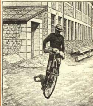
A.—Señor girando a la izquierda a tontas y a locas

Gire usted sin miedo a la derecha o a la izquierda, pero hágalo científicamente. No lo haga a tontas y a locas porque se puede usted estar jugando el futuro. Ya sabe lo que son las cosas de la política.