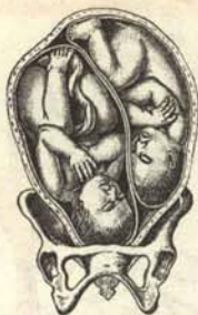
Fig. 388. Gemelos (presentación de cabeza).

ESPAÑOLITOS que venís al mundo os guarde Dios una de las dos Españas (1) ha de helaros el riñón.