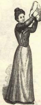
Se agita mezclado con hielo y vodka, como si fuera una cocktailera.