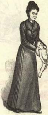
Se coge cuidadosamente por las axilas al último hijo del señor Molotof.