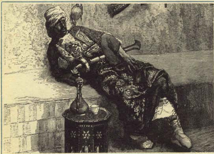
—... Y luego le meteremos mano a las aguas minerales.