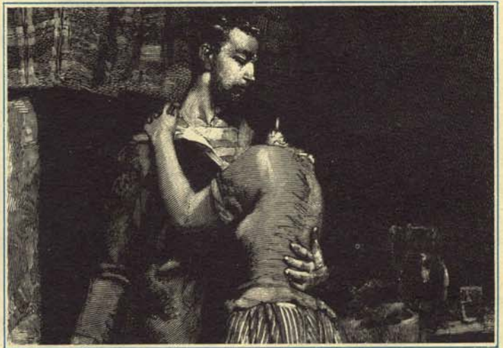
—No te pongas así, mujer. ¡Ni que fuese a volar sobre Francia!