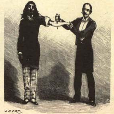
1. «Progre» recibiendo el agujonazo de la vacuna extraída de los textos de notabilísimos autores modernos.

Como todos los años por estas fechas, en las instituciones correspondientes se está procediendo a la vacunación masiva y gratuita de todos los «progres» que lo deseen. Ofrecemos un reportaje de tan loable acto preventivo.