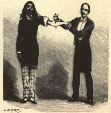
1. «Progre» recibiendo el agujonazo de la vacuna extraída de los textos de notabilísimos autores modernos.

Como todos los años por estas fechas, en las instituciones correspondientes se está procediendo a la vacunación masiva y gratuita de todos los «progres» que lo deseen. Ofrecemos un reportaje de tan loable acto preventivo.