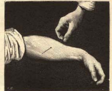
2. Primer plano del agujonazo, que por cierto es indoloro.