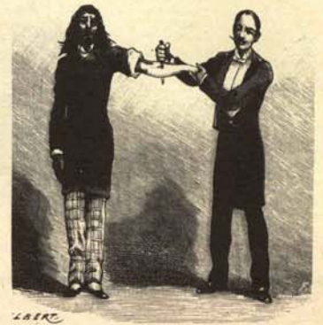
1. «Progre» recibiendo el agujonazo de la vacuna extraída de los textos de notabilísimos autores modernos.

Como todos los años por estas fechas, en las instituciones correspondientes se está procediendo a la vacunación masiva y gratuita de todos los «progres» que lo deseen. Ofrecemos un reportaje de tan loable acto preventivo.