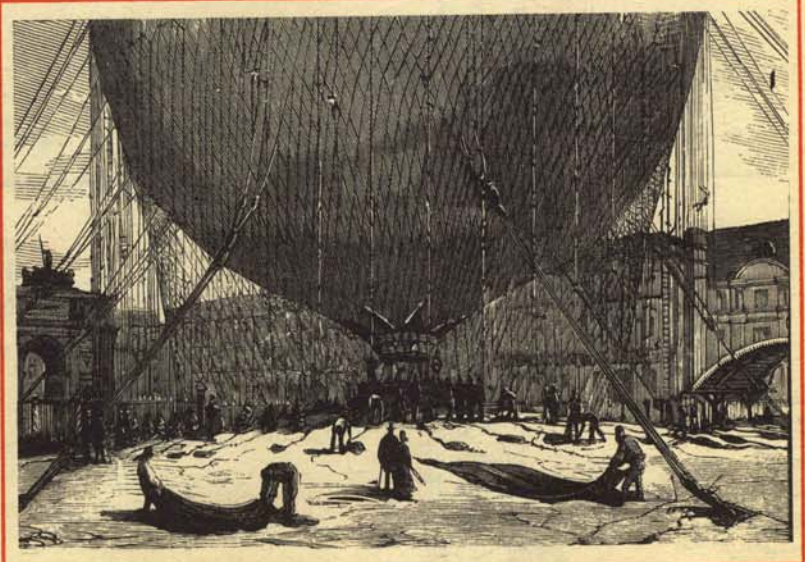
Solemnes preparativos que algunos grupos financieros están realizando para celebrar el primer aniversario de la ascensión de los precios de los carburantes.