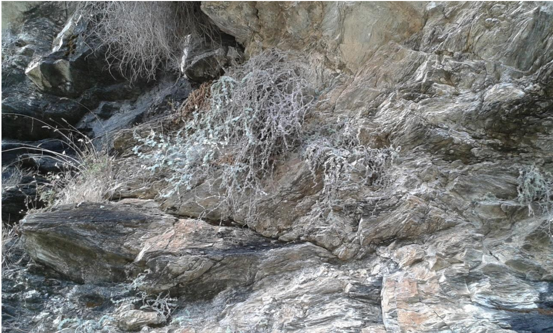
Figura 1.3. A. lopesianum sobre roquedos de gneis en Cabezo das Freiras, río Sabor, Grijó de Parada (Bragança) el 17/06/2019.