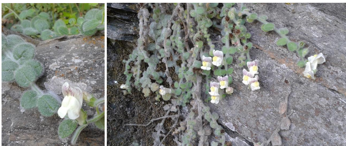
Figura 1.1. Hábito de A. lopesianum , detalle de las flores (Imagen izquierda) y de sus delgados tallos (Imagen derecha). (Imagen izquierda): Playa del Rostro, Aldeadávila de la Ribera (Salamanca) el 1/05/2019, (Imagen derecha): Puente entre Carção y Vimioso sobre el río Maçãs, Carção (Bragança) el 10/05/2019.

Esta especie, cuyo sinónimo es Antirrhinum molle subsp. lopesianum (Rothm.) P. Silva (Güemes, 2009), fue colectada por Manuel Ferreira en 1879 en los alrededores de Bragança (Gomes et al., 2013). En 1926, el párroco Miranda Lopes realizó una herborización del mismo en el entorno de Argozelo (Bragança), cuyo pliego fue estudiado por el botánico teutón Werner Rothmaler y nombrado más tarde con el nombre con el que actualmente conocemos a este taxón (Aguiar, 2000). No siendo localizado en España hasta 1989, por Amich y Sánchez Rodríguez en Aldeadávila de la Ribera (Amich et al., 1989).