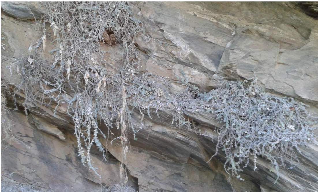
Figura 1.2. A. lopesianum sobre roquedos de gneis en Aldeadávila de la Ribera (Salamanca) el 1/05/2019.

La inflorescencia es laxa, con 4-13 flores alternas, de flores con corola (19-30 milímetros) de color blanco, con venas purpúreas-violáceas, paladar blanco-amarillento y lóbulos del labio superior con estriación violeta (González Talaván et al., 2004). Cuando fructifican, generan una cápsula de pocos milímetros, subglobosa, pubescente, con pequeñas semillas (0,7-0,9 milímetros), de oblongo-ovoides a subcónicas, crestadas, en ocasiones irregularmente reticuladas, pardo oscuras (Güemes, 2009). La floración tiene lugar entre los meses de abril y mayo, donde media la polinización entomófila (Amich et al., 2004), mientras la fructificación se da en verano, desde julio a septiembre (Bernardos et al., 2006).