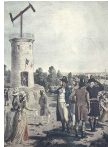
Fig.1. Telégrafo de Chappe

Historia del telégrafo: En la época moderna, durante siglos XVII y XVIII, se intentaron diversos experimentos de comunicación a distancia valiéndose de nuevos descubrimientos científicos. Fue en el año de 1794 cuando C. Chappe 1 , después de intentar construir un telégrafo eléctrico y otro acústico, construyó entre Paris y Lille una línea telegráfica óptica. Este sistema se extendió rápidamente cubriendo en poco tiempo una longitud de 5.000 Km. El problema de este tipo de telégrafos era el tiempo era el tiempo necesario para garantizar la fidelidad de la comunicación.