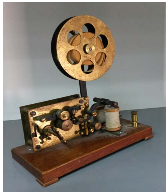
Fig.7. Receptor Morse de la USAL