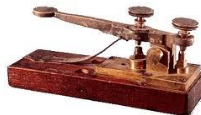
Fig.6. Emisor Morse