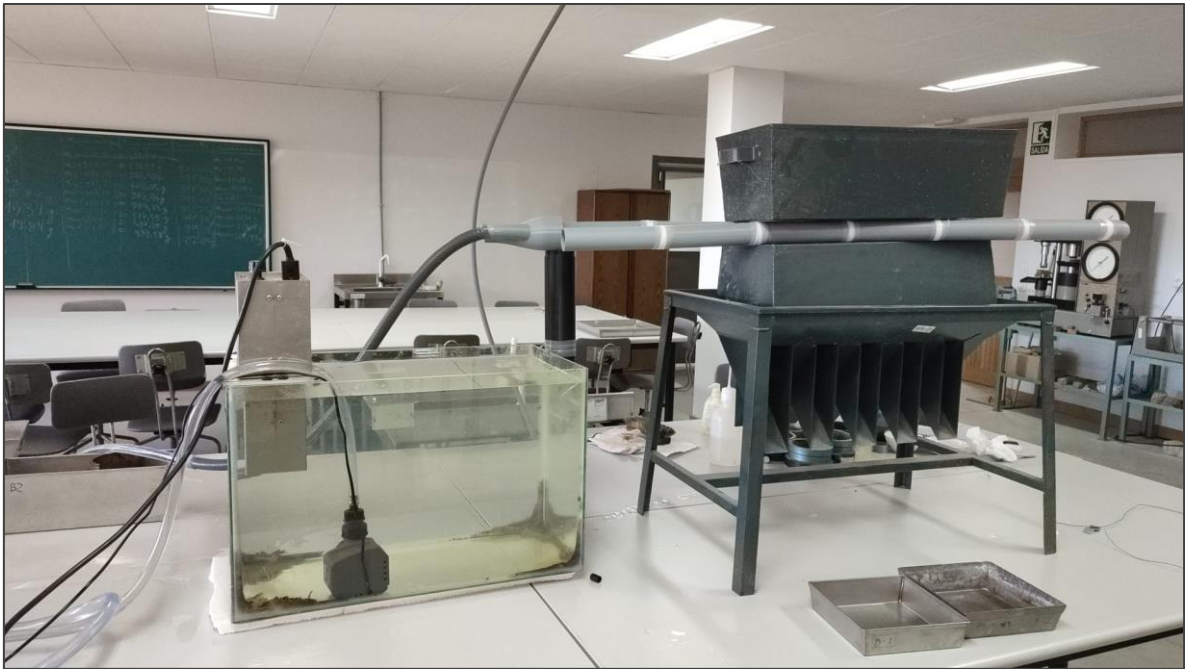
Figura 4. Dispositivo de simulación integrado con los modelos 3D impresos y un sistema de bombeo y calentamiento del fluido.