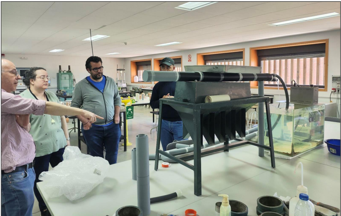
Figura 5. Explicación y taller con el dispositivo en funcionamiento al alumnado.