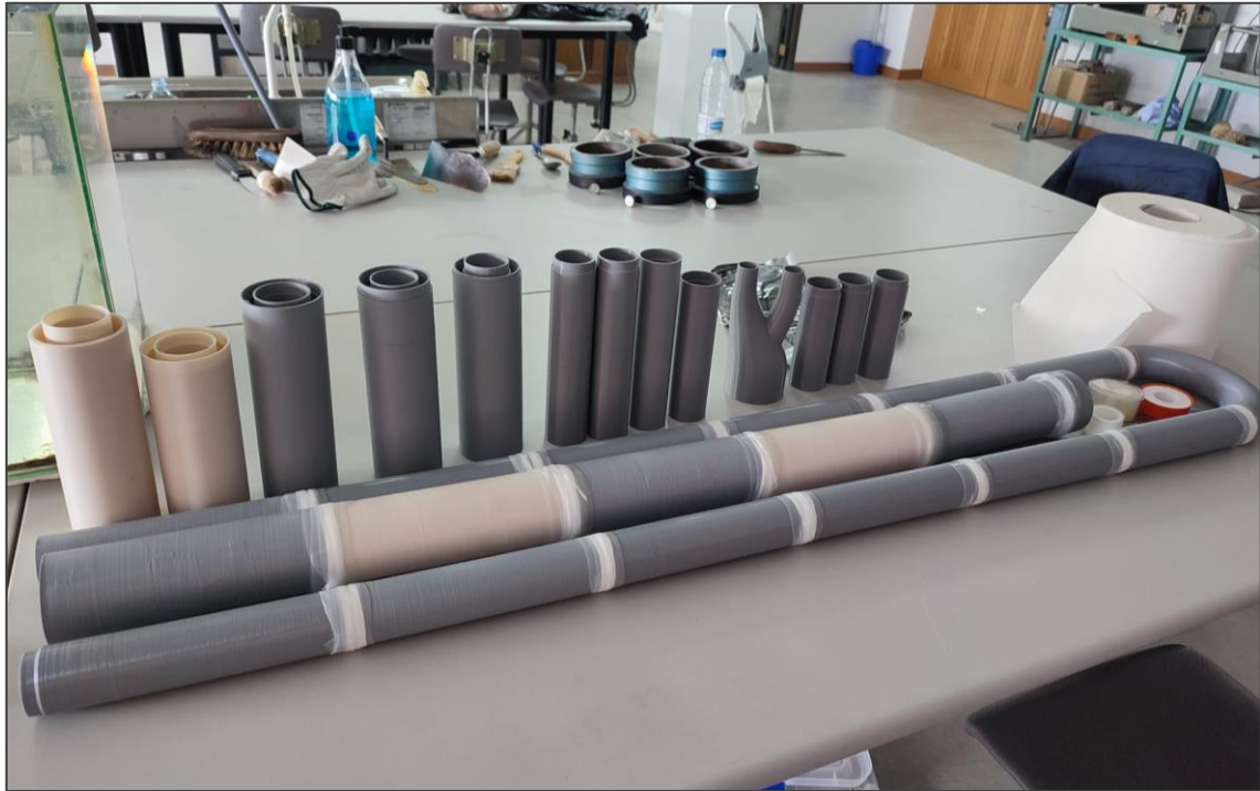
Figura 3. Piezas impresas para el desarrollo del modelo de simulación final.