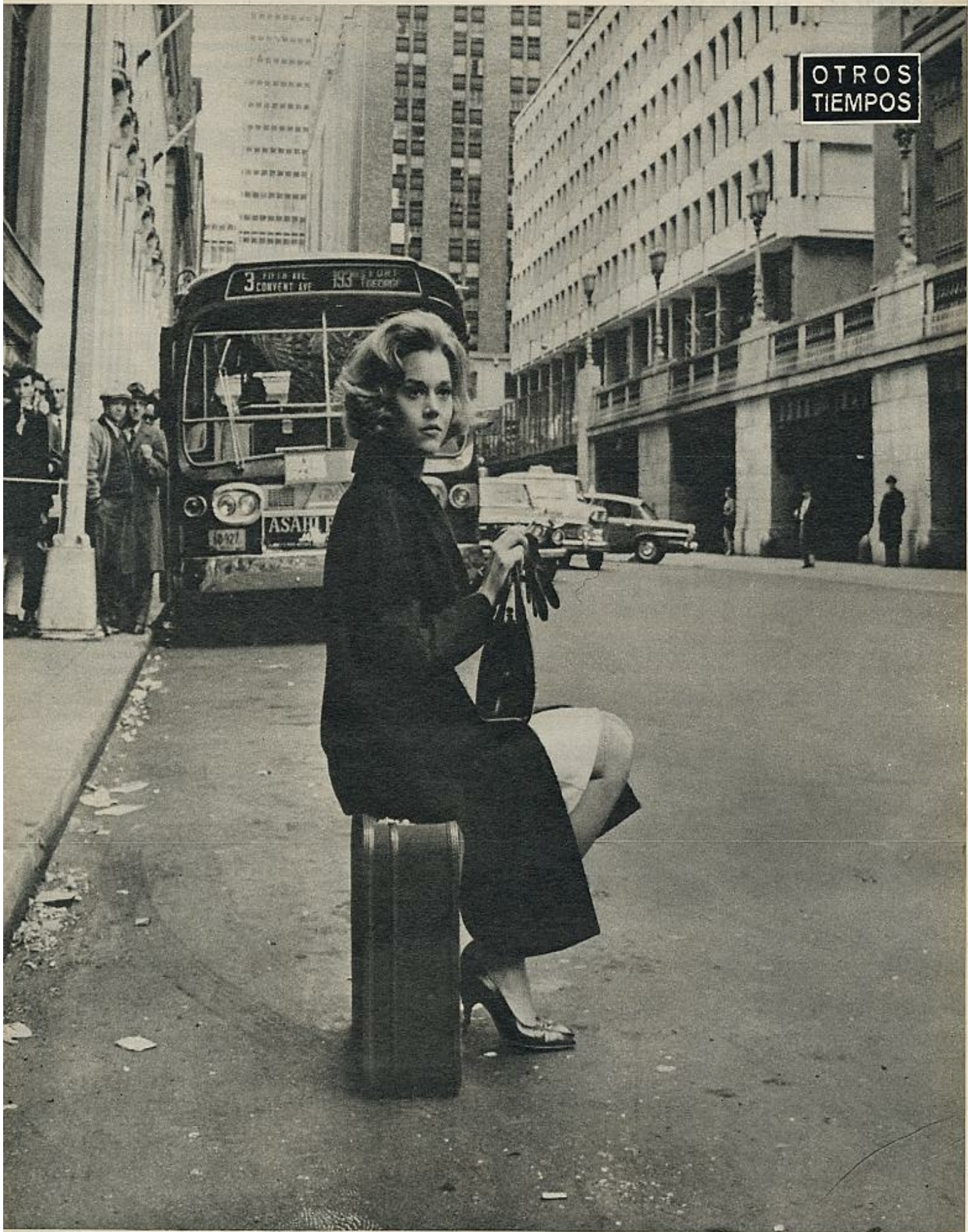
ayton Place». Sobre estas líneas, Jane Fonda, hija del excelente actor Henry Fonda. De Jane hemos visto en nuestras pantallas «Me casaré contigo» y «La gata negra». Jane empo conseguirá convertirse en una gran estrella, la que Hollywood necesita para reemplazar sus viejos mitos. Es la mejor de todas las nuevas actrices de EE. UU.