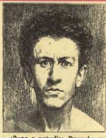
—¿Pues a estudiar Derecho sustit!