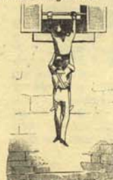
1. Método a seguir para los robos con escaló.

Ante el aumento del número de robos, hurtos y demás latrocinios observados últimamente, las autoridades competentes se han visto obligadas a reglamentar dichos actos con las siguientes normas obligatorias: