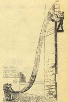
5. Cuidados que deben tomarse los delincuentes cuando se roben mujeres, niños o cualquier otro objeto delicado y frágil.