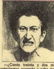
—¿Ciento treinta y dos mil setecientos cuarenta y ocho macarrulados?